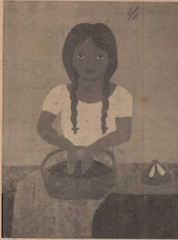
Oleo pintado por Yolanda a los 13 años de edad

Le señora puso casa. Las hijas buenazas, natonas y que movían las enaguas se casaron seguramente con el caballero que las rondaba a caballo y que les cantaba serenatas por la noche. Y la se-