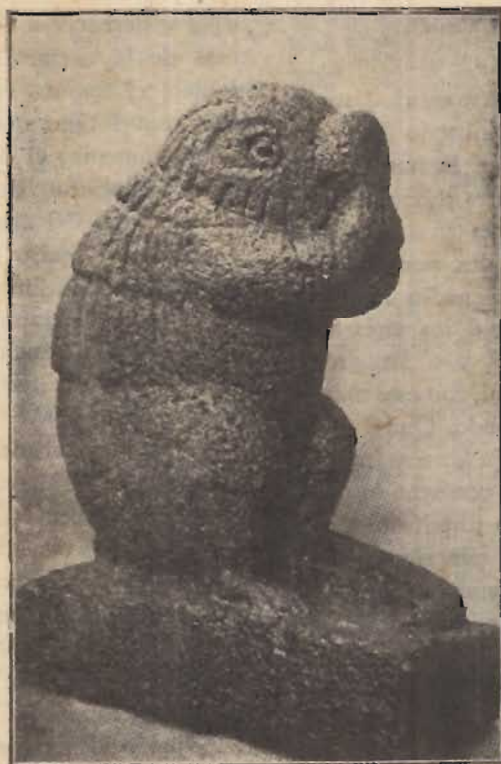
PUERCOESPIN ESCULPIDO EN BASALTO NEGRO