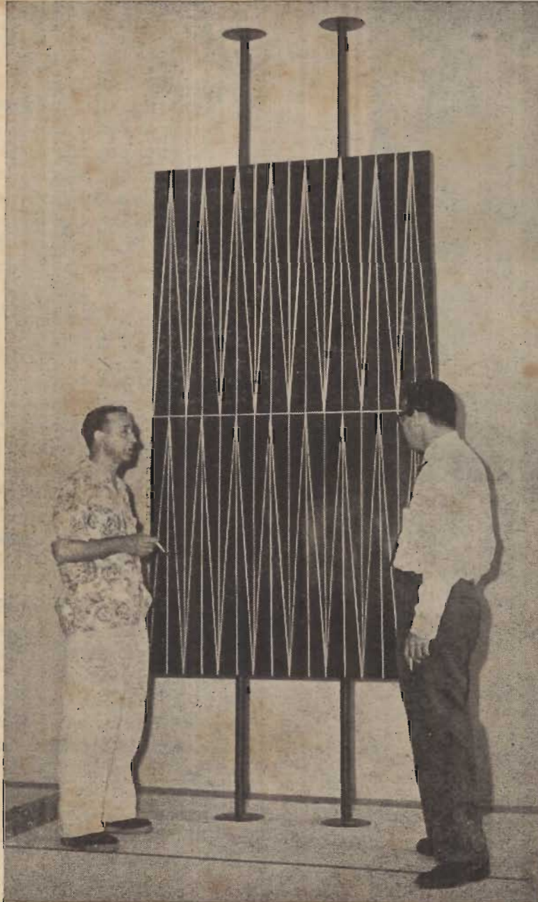
El autor de este artículo fotografiado ante uno de sus últimos ensayos de integración arquitectónica para el nuevo edificio de "Radio Popular" Radio y Televisión, de Maracaibo, Venezuela.

"La pintura es cosa mental" Leonardo de Vinci. (Tratado de la Pintura).