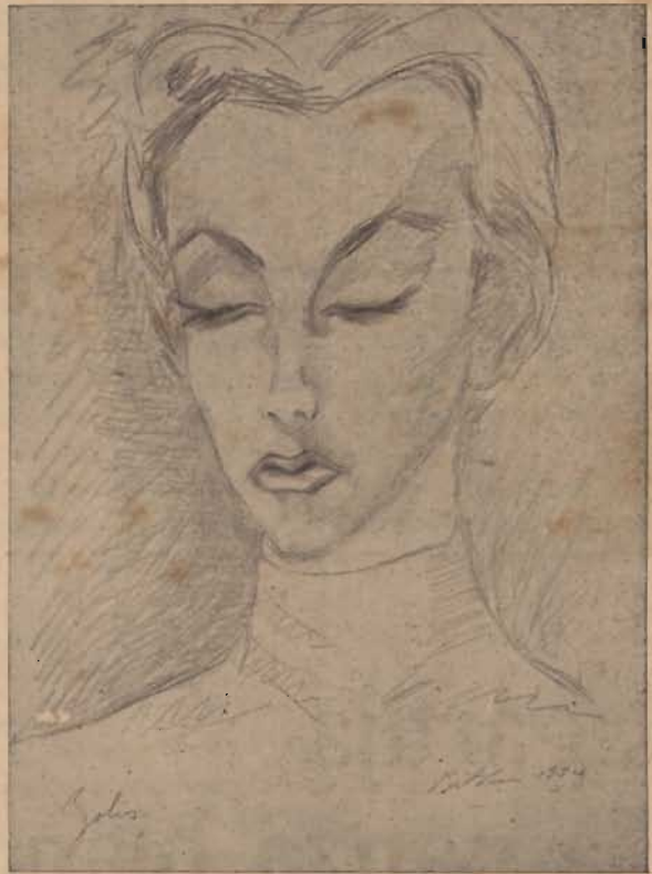
Frente al lápiz de MARGARITA BERTHEAU

En la muerte de Yolanda Oreamuno, que nosotros, con toda la intelectualidad costarricense, sentimos en lo más hondo del alma, como rendido homenaje a su ilustre memoria publicamos un artículo y un cuento suyos, aparecidos hace años en Repertorio Americano. Gracias al excelente don Joaquín García Monge, a quien damos las gracias, podemos ofrecer estas bellas prosas de nuestra escritora inmortal.